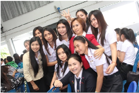
รูปภาพที่ 1.1 มิตรภาพระหว่างวัย

เพศวิถีศึกษา มีความสำคัญต่อการพัฒนาทางด้านสติปัญญา อารมณ์และร่างกายของมนุษย์ เพื่อให้มนุษย์มีพัฒนาการที่สมบูรณ์พร้อม และเตรียมรับมือกับการเปลี่ยนแปลงที่จะเกิดขึ้น โดยรู้จักความเสี่ยง โอกาสเกิดความเสี่ยง ตลอดจนวิธีป้องกัน ดูแล รักษาสุขภาพร่างกายให้แข็งแรงตามวัย โดยเฉพาะการจัดการเรียนการสอนเพศศึกษาสำหรับนักเรียน นักศึกษา ในช่วงวัยรุ่น ซึ่งเป็นวัยแห่งการเรียนรู้ และอยากรู้อยากลอง ได้เข้าใจถึงธรรมชาติของการเปลี่ยนแปลงของมนุษย์ มีสติ และรู้เท่าทันพัฒนาการของตนเองในทุกด้าน เปรียบเสมือนการสร้างภูมิคุ้มกันป้องกันตนเองเมื่อเติบโต ซึ่งสามารถสรุปความสำคัญของการจัดการเรียนการสอนวิชาเพศวิถีศึกษา ในประเด็นที่สำคัญ ๆ และที่น่าสนใจดังนี้