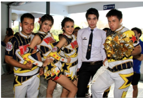
รูปภาพที่ 1.2 เพศวิถีศึกษาทำให้เข้าใจ และยอมรับถึงความแตกต่างทางเพศ

การแบ่งแยกเพศต่าง ๆ นั้นสามารถจำแนกได้หลากหลาย ดังที่กล่าวมาแล้วในหัวข้อข้างต้น ทั้งนี้ เพศ ในทางชีววิทยาได้จำแนกเพศของมนุษย์และสัตว์ตามเพศกำเนิด หรืออัตลักษณ์ทางเพศ (Gender identity) เพียง 2 เพศคือ เพศชาย (Male sex) และเพศหญิง (Female sex) ซึ่งจำแนกตามลักษณะอวัยวะเพศ และโครโมโซมเพศของมนุษย์โดยแรกเกิด